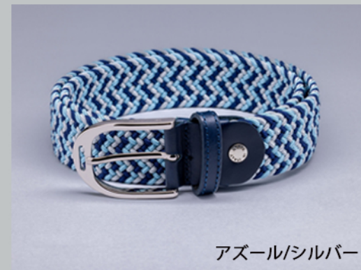
アズール/シルバー