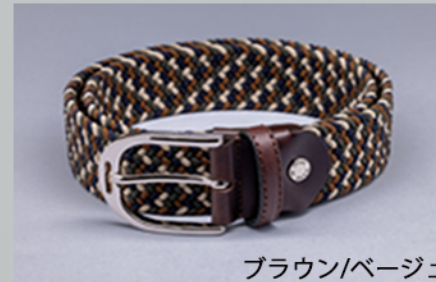
ブラウン/ベージュ